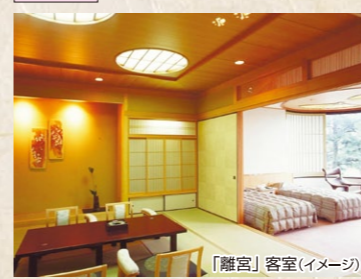
「離宮」客室(イメージ)