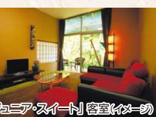
「ジュニアスイート」客室(イメージ)