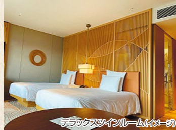
デラックスツインルーム(イメージ)